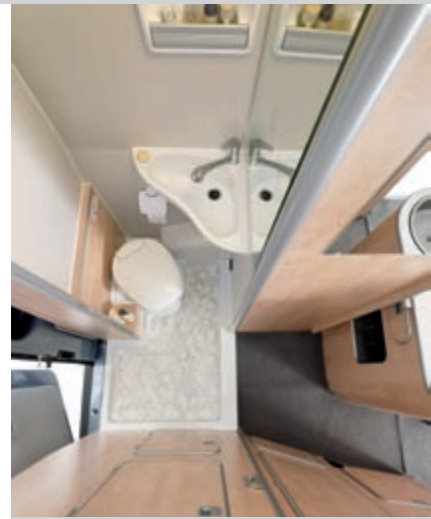
Durch das einzigartige 4-Raum-Konzept sind die einzelnen Lebensbereiche Wohnen, Schlafen, Kochen und Bad voneinander unabhängig und gleichzeitig nutzbar.

Die großzügig gestaltete Sitzgruppe bietet viel Fahr- und Wohn-Komfort. Es stehen fünf Sitzplätze mit 3-Punkt-Gurten zur Verfügung.