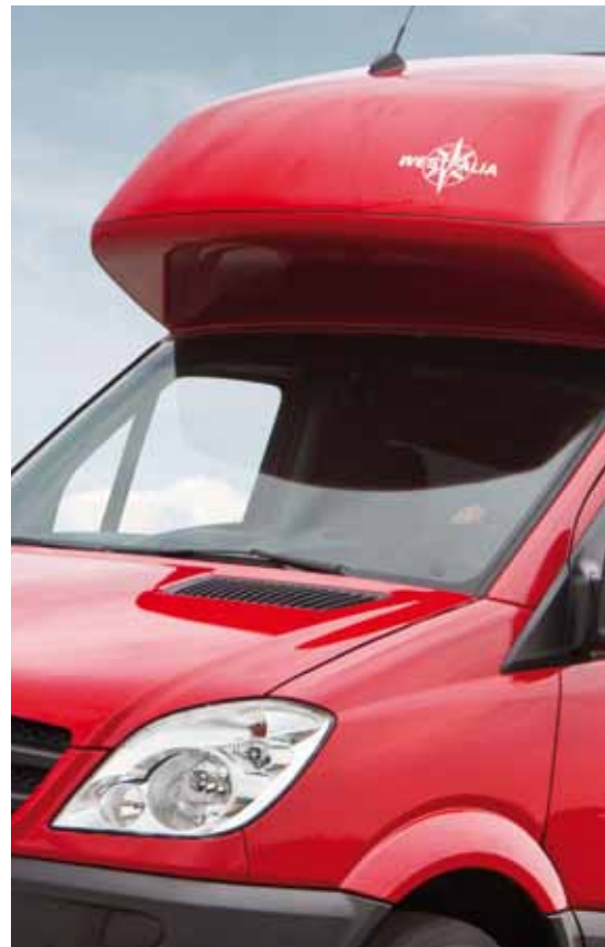
▲ Unterstreicht die avantgardistische Fahrzeuglinie – das Hochdach des Sven Hedin.