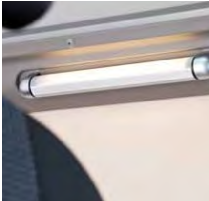
▼ Hell und freundlich – das Beleuchtungskonzept im Sven Hedin.