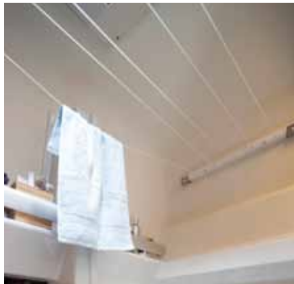
◀ ▼ Einfach durchdacht – das Sven Hedin Stauraumkonzept.