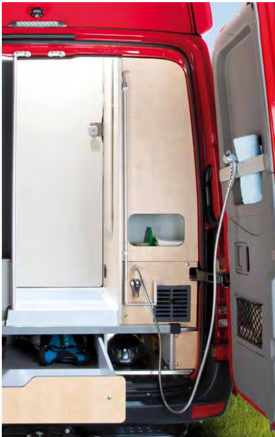
▲ Ob Außendusche oder XXL-Schubladen – auch das Heck des Sven Hedin bietet überzeugende Detaillösungen.