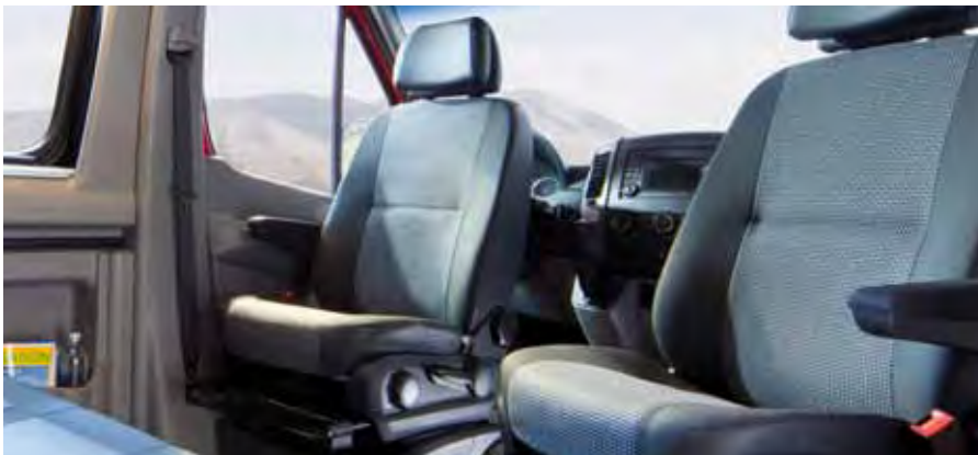
▲ Maß der Ergonomie – die ausgeformten Cockpit-Sitze im Sven Hedin.