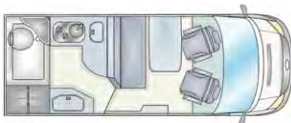
Nacht: Bett im Obergeschoss / Untergeschoss