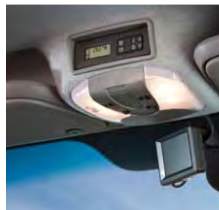
▲ Alles im Griff – das Bedienpanel für die Bordelektrik im Sven Hedin.