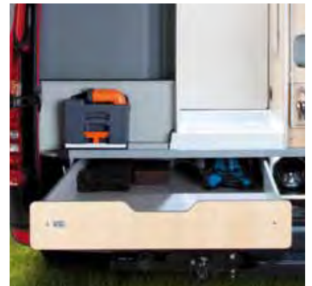
▼ Perfekte Funktion und ansprechendes Design – der Sven Hedin überzeugt auf den ersten und begeistert auf den zweiten Blick.